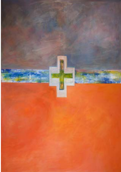
Kreuz-Bild von Ulrike Schink

Seit September 2013 findet am dritten Mittwoch im Monat ab 18:30 Uhr eine kurze „Fenster zum Himmel - Andacht“ in der kleinen Kapelle der Stiftskirche statt. Wir gestalten diese Andacht ökumenisch. Sie wird von verschiedenen Mitarbeitern/Innen der katholischen St. Ansgar Kirchengemeinde und unserer evangelischen Kirchengemeinde vorbereitet und geleitet. So ergibt sich eine Abwechslung der Themen. Gleichbleibend ist der meditative Rahmen mit Wechselgebeten, Liedern, Zeit für Austausch und Stille. Lesungen und ein Gespräch über das Gehörte sind auch ein möglicher Bestandteil der