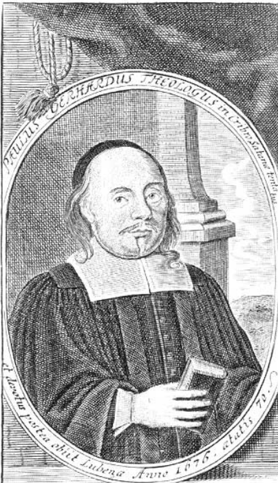
Paul Gerhardt, Kupferstich aus dem 17. Jahrhundert

gerne nach draußen gehen und sich in der Sonne räkeln. Auch wir Menschen genießen es, wenn wir endlich wieder draußen sein können, ohne Schal, Handschuhe, Mütze. Und die „liebe Sommerzeit“ verspricht ja noch viel mehr: Milde Sommerabende auf der Terrasse oder dem Balkon, Ferien, Urlaub, Reisen, Erholung. - Vielleicht auch ein bisschen Zeit für Gott?