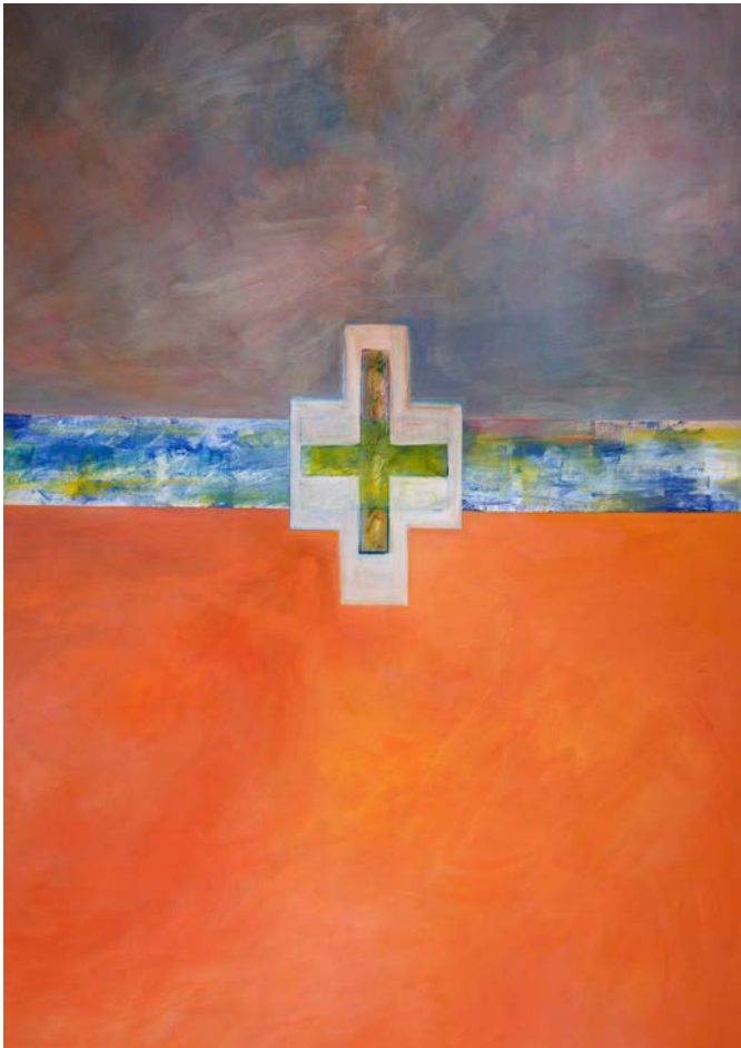
Kreuz-Bild von Ulrike Schink in der kleinen Kapelle der Stiftskirche