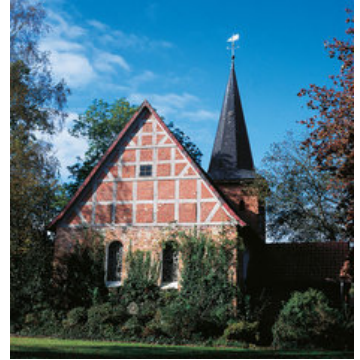
Kirche Nordwohldede