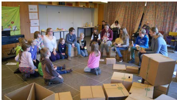
.....1 x im Monat ab 11 Uhr im Gemeindehaus, Stift 6

Am 7.Juni und 12.Juli finden die nächsten Kindergottesdienste im Gemeindehaus parallel zum Hauptgottesdienst um 11:00 Uhr statt. Konfirmanden, Jugendliche und engagierte Erwachsene bereiten für euch diese Sonntagstermine vor. Euch erwarten dann gespielte biblische Geschichten, fröhliche Lieder, gute Gebete und jede