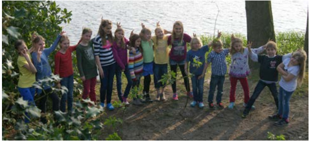
Ein Bild aus dem 30. Jahr der Bassumer Kinderkantorei - jeder einzelne Fuß dieser Kinder steht für ein zeitliches Jahr Chorgeschichte.

teilen. In einem Konzert am Samstag, den 18.07. um 16:00 Uhr möchte die Kinderkantorei einen kleinen Geschichtsrückblick mit verschiedensten gesungenen, und auch gerapten Liedern geben. Das Konzert mit einer kleinen Pause ist zu freiem Eintritt zu erleben. Und es wird nicht nur gesungen. Auch instrumentale Werke, gespielt von Kindern und Jugendlichen, stehen auf dem Programm. Am Ausgang können Sie dann einen gedruckten Bilder- und Textrückblick dieser dreißig Jahre mitnehmen – An dieser Stelle ein herzliches Dankeschön an die Volksbank, unseren Hauptsponsor dafür.